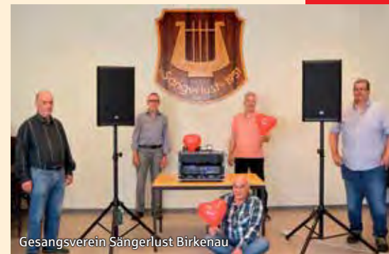
Gesangsverein Sängerkunst Birkenau