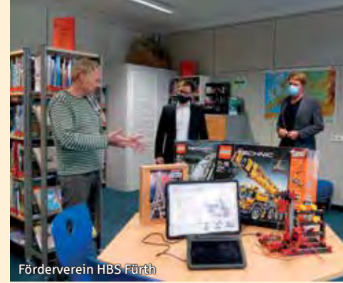
Förderverein HBS Fürth