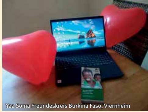
Yaa Soma Freundeskreis Burkina Faso, Viernheim