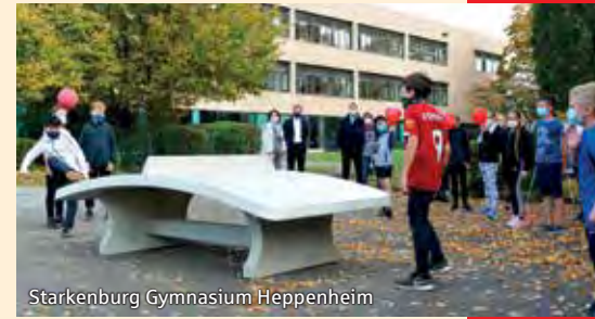
Starkenburger Gymnasium Heppenheim