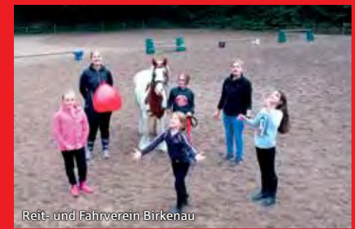
Reit- und Fahrverein Birkenau