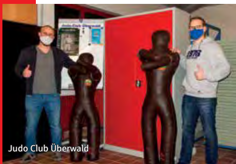
Judo Club Überwald