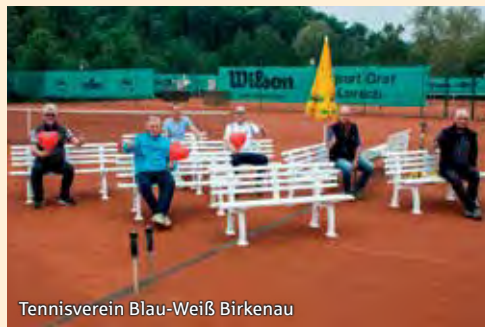
Tennisverein Blau-Weiß Birkenau