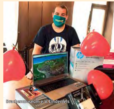
Drachenseum e.V. Lindenfels