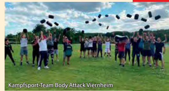
Kampfsport-Team Body Attack Viernheim