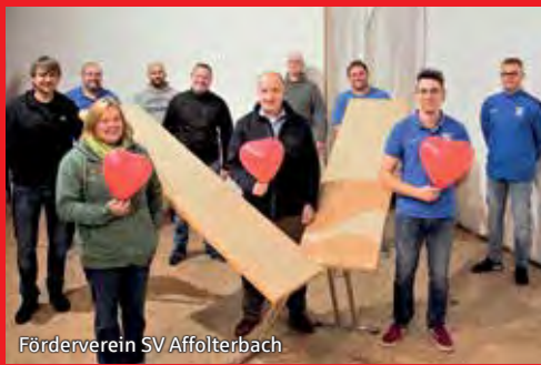
Förderverein SV Affolterbach