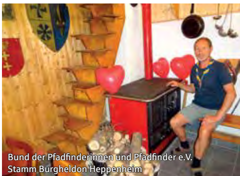
Bund der Pfadfinderinnen und Pfadfinder e.V. Stamm Burgheldon Heppenheim