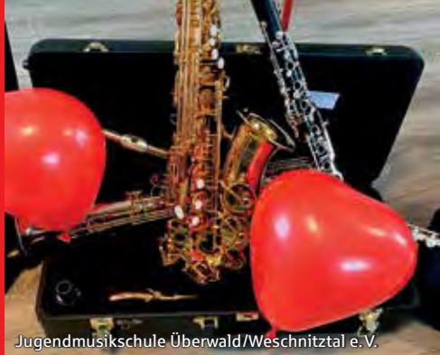
Jugendmusikschule Überwald/Weschnitztal e.V.