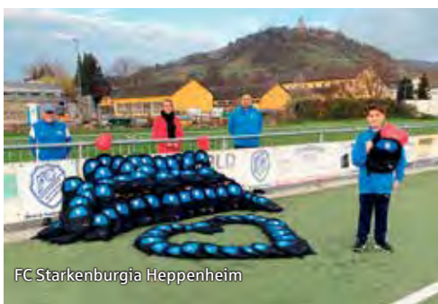
FC Starkenburgia Heppenheim