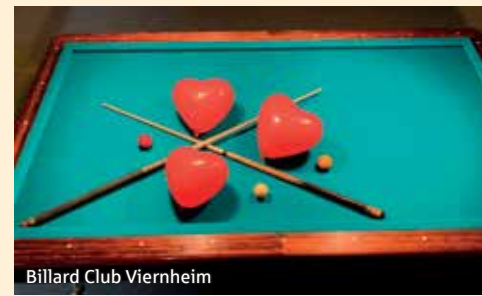
Billard Club Viernheim