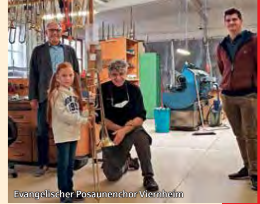
Evangelischer Posaunenchor Viernheim