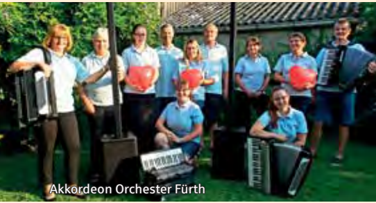
Akkordeon Orchester Fürth