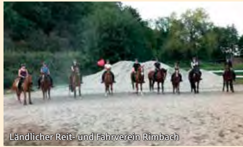
Ländlicher Reit- und Fahrverein Rimbach