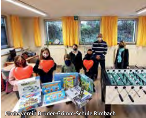
Förderverein Brüder-Grimm-Schule Rimbach