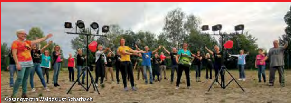
Gesangverein Waldeslust Scharbach